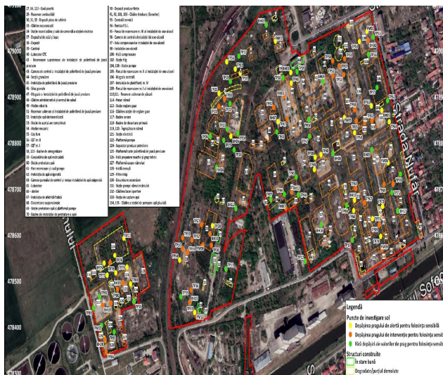
Puncte de investigare sol

Niciuna dintre aceste proceduri aflate în derulare nu sunt finalizate, iar acestea nu sunt menite să confere dreptul de construire/edificare de obiective. Acestea vor stabili obligații în sarcina titularului, de realizare a proiectului de remediere, de decontaminare a solului/subsolului și mediului geologic, de îndeplinire a obligațiilor de mediu și de a pune bazele unei dezvoltări durabile ulterioare a zonei.